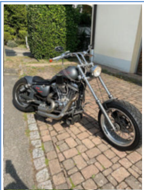
Ehrenkirchen im Januar 2026

Wenn Liebe einen Weg zum Himmel fände und Erinnerungen zu Stufen würden, dann würden wir hinaufsteigen und dich zurückholen.