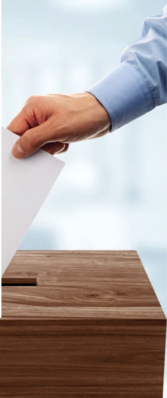
Thomas Breig Bürgermeister