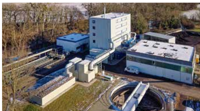
Neue P-XTRACT Anlage (Januar 2024)

Im Juli 2024 konnte der AZV nach rund zweijähriger Bauzeit die sogenannte P-XTRACT Anlage in Betrieb nehmen. Mit dieser Investition verwirklicht der Verband ein ganz neues Konzept der Rohstoffwiedergewinnung. Hierbei handelt es sich um eine Klärschlammverwertungsanlage mit integrierter Phosphorrückgewinnung. Aus Klärschlamm, der vorher weggefahren und verbrannt werden musste, wird nun wertvoller Pflanzendünger hergestellt. Die Gesamtkosten des Projekts beliefen sich auf ca. 11 Mio. €. Der AZV erhielt aus Mitteln des Europäischen Fonds für regionale Entwicklung (EFRE) und vom Land Baden-Württemberg insgesamt rund 4,25 Mio. € Fördergelder.